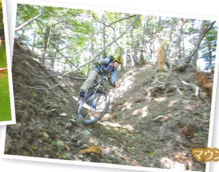
マウンテンバイク